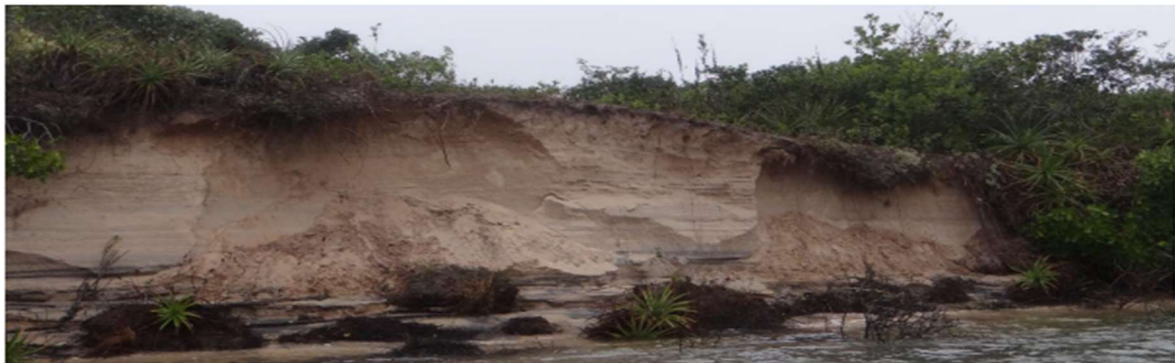
Foto 6. Vista da parte interna do pontal da Ilha do Cardoso sofrendo erosão.

a) Melão: Trecho do pontal onde a erosão reduziu a faixa de terra a aproximadamente 48 a 50 metros de largura no ponto mais estreito, evidenciando risco iminente de novo rompimento (fls. 200/220). A área é atacada simultaneamente pelas águas do canal e pelo mar oceânico, com evidências contundentes do processo erosivo, tais como árvores de restinga derrubadas, vegetação costeira destruída e desbarrancamento das margens (fls. 200/220);