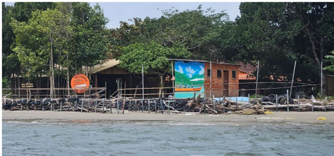
Foto 12. Trecho da Praia Itacuruçá/Pereirinha visto do mar. Notar as estruturas de contenção/proteção.

tradicional, incluindo residências e estabelecimentos comerciais essenciais à subsistência das famílias (fls. 49/65 e 200/220).