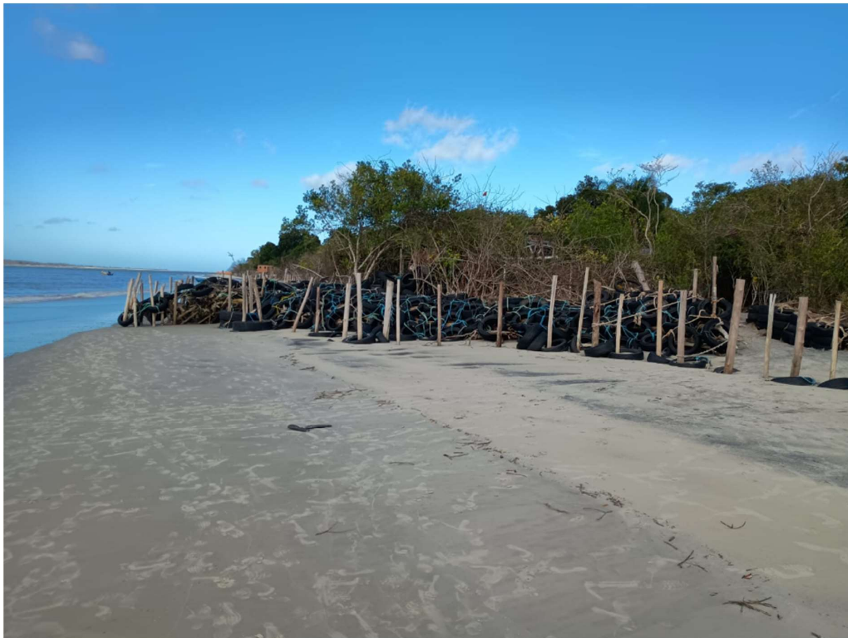
Fotografia por este subscritor – outubro/2025

Em julho de 2025, o Centro de Apoio Operacional às Promotorias de Justiça do Meio Ambiente (CAEX) realizou vistoria técnica na Ilha do Cardoso, confirmando a gravidade da situação (fls. 183 e 200/220). O parecer técnico evidenciou que o avanço da linha de costa decorre da elevação do nível do mar e do aumento da frequência de eventos extremos, ambos relacionados às mudanças climáticas (fls. 200/220).