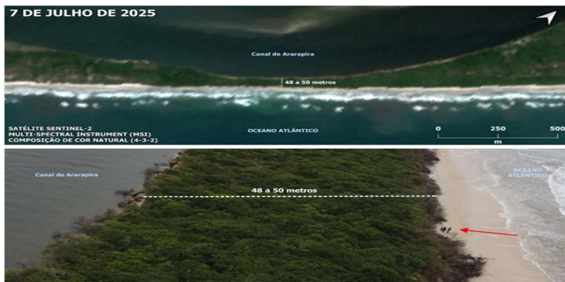
Figura 7. Estimativa da largura do trecho mais estreito do pontal. Imagem Sentinel-2 e fotografia aérea (ARP/drone).

((imagens de fls. 210/212 do Inquérito Civil anexo))