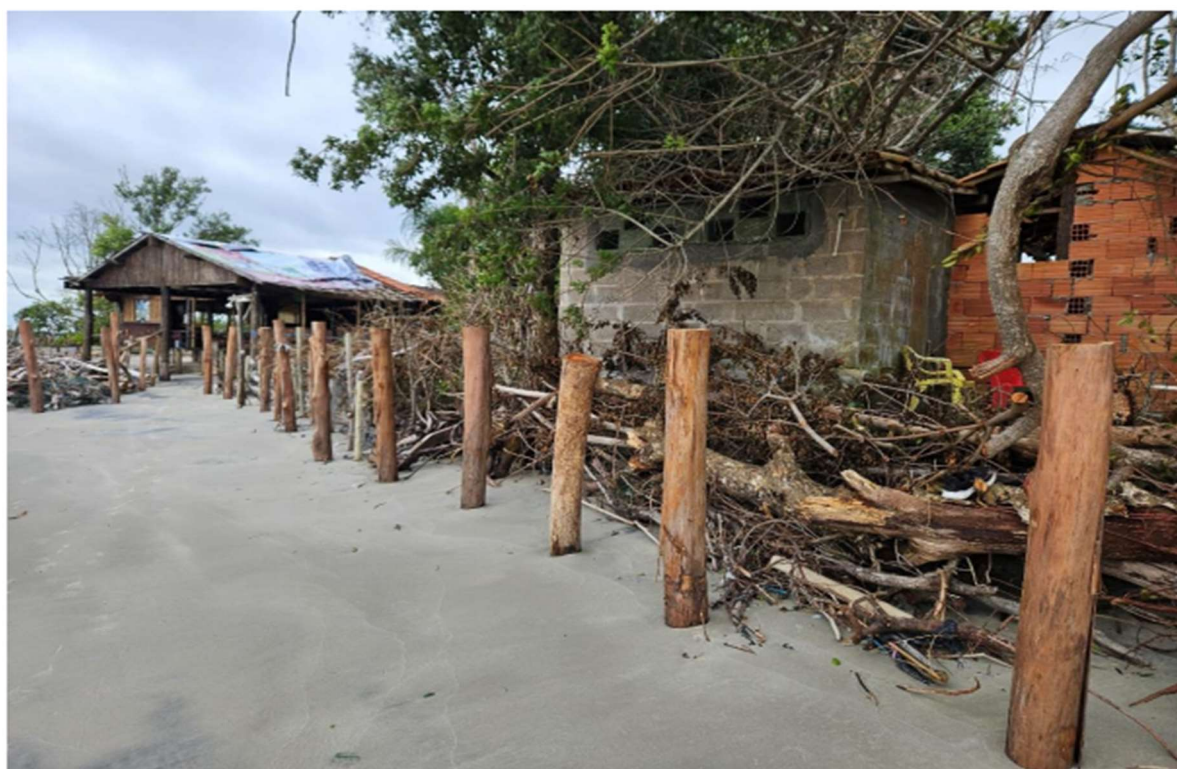
Foto 14. Detalhe da estrutura de contenção/proteção próximo às edificações comerciais.

(imagens de fls. 215/217 do Inquérito Civil anexo)