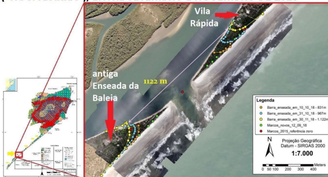
(imagem de fls. 423 do Inquérito Civil anexo)