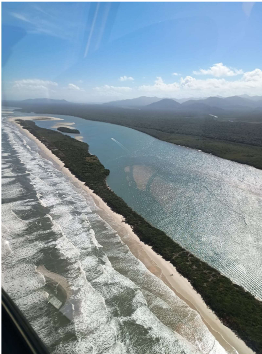
Fotografia aérea por este subscritor – outubro/2025

b) Pereirinha: A praia vem sofrendo erosão progressiva, com redução da faixa de areia, ameaçando diretamente as edificações da comunidade