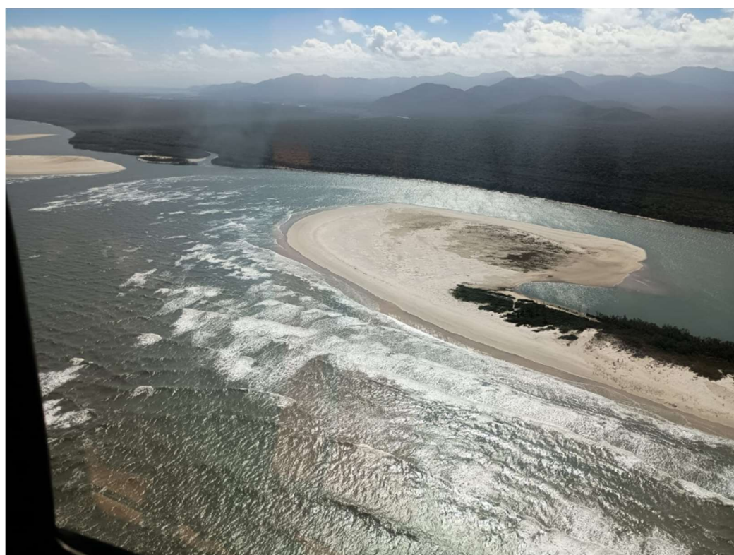
Fotografia aérea por este subscritor – outubro/2025