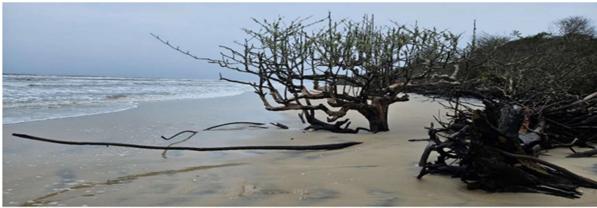
Foto 8. Vista da parte externa (mar aberto) do pontal da Ilha do Cardoso sofrendo erosão, evidenciada pela vegetação de restinga afetada pelas ondas.